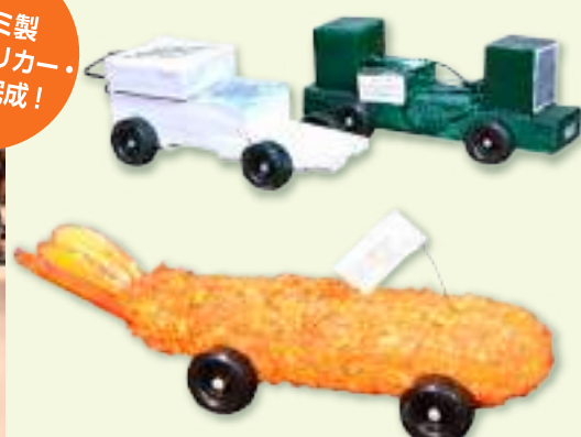
聖句旗付きエビフライカー (作品提供 棚田伊作さん・主喜さん)