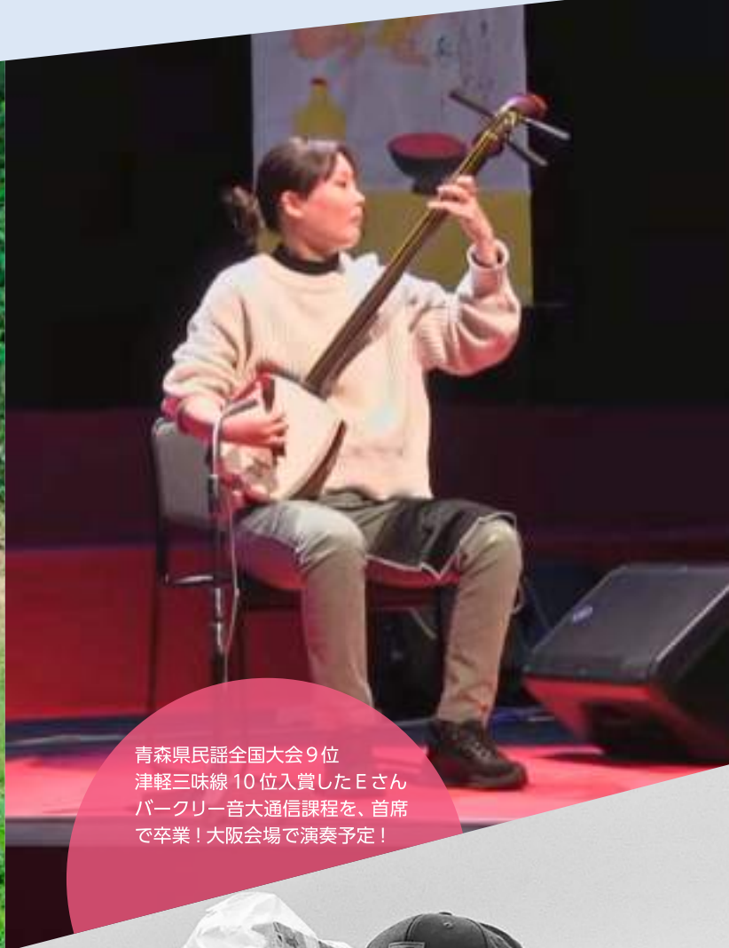
青森県民謡全国大会9位 津軽三味線 10 位入賞したEさん パークリー音大通信課程を、首席で卒業！大阪会場で演奏予定！