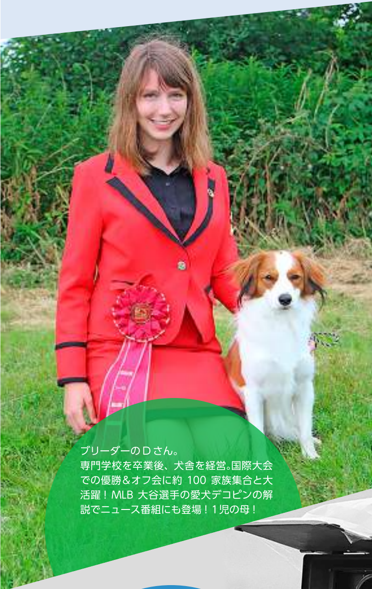
ブリーダーのDさん。 専門学校を卒業後、犬舎を経営。国際大会での優勝&オフ会に約 100 家族集会と大活躍！MLB 大谷選手の愛犬デコピンの解説でニュース番組にも登場！1児の母！

ホームスクーラー初の裁判官となったA君、青山学院大を卒業しバスの運転手となったB君、伝道ミッションを重ねながら柔道整復師として勤務するCさん、医大に合格し、イエス様の栄光を伝えんとするD君、チャーチスクール、ホームスクーリングを卒業後、牧師/伝道者として活躍するE君・F君ほか、皆さん、様々な分野にチャレンジされています。