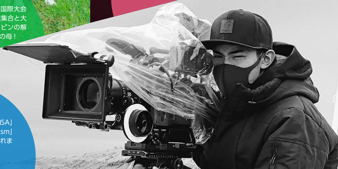
撮影中のF君。 CM「日清カップヌードル」[VISA] [NIKE]: MV「Official 髭男dism」 高認取得後、カメラマンに導かれました