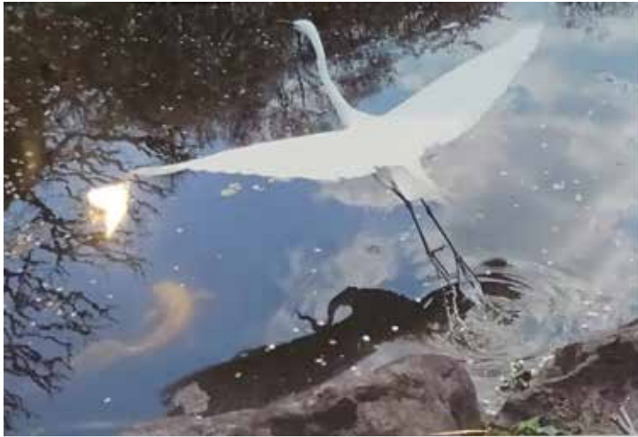
チア・につぼん写真コンクール最優秀作品賞 「翔べ！」 森山 陽介

「水面に映る景色のゆらめき。ゆったりとした時間を切り取るようにサギが水面をけて羽ばたきました」