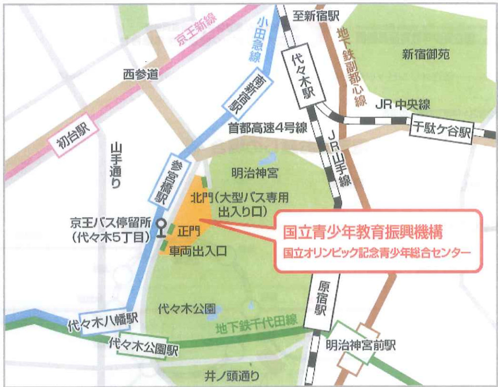
参宮橋からの[歩道橋]を使った経路