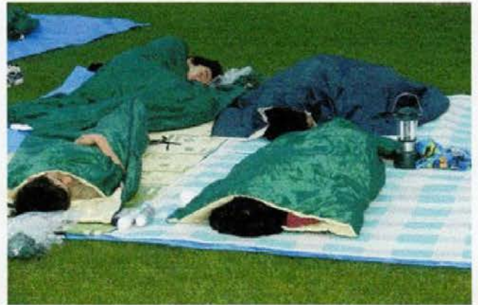
将来の伝道に備え、野宿にも初挑戦。野宿体験「楽しかった！」

その後、主の召しに従ひ、伝道者となろう、兄のいない、日本以外の国に行こうと思ひました。でも、「日本」を主に迫られたと思ひ、日本で伝道することにしました。