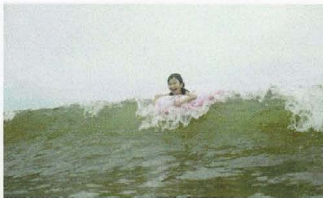
豪快な波が大好評だった新ビーチ

になりましたが、ずっと指導いただき、チアにとっても大切なブレインとなってくれていました。