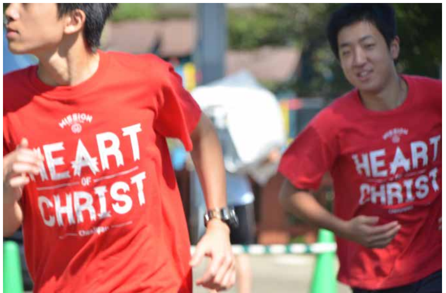
チアの若者・親たちが、2週間のソーシャルメディア断食に挑んだ！ (2月中旬 ~ 3月上旬にかけて)

ハレルヤ！ 皆さん、お元気ですか。今、気温 39 度の暑いロサンゼルスから、日本に向かう飛行機の中です。先月、チア・サポートスクール保護者会で、「Impact！ どうやって、この世界をキリストにあって変革していくのか？ — ソーシャルネットワークと友達依存へのチャレンジ」と題して分かち合わせていただきました。希望した親とティーンたちに「2週間のソーシャルメディア断食」を実験的に行いました。単に、「ソーシャルメディア」と縁を切ってみようということではなく、今後、社会に福音のインパクトを与えていくために、キリスト以外のあらゆる支配から脱却する体験をしようという試みです。一言で言えば、とても良かったです。チャレンジの皆さんたちからのレポートも毎日、届きました。その内容が、とてもすごいです（13 ページ以降参照）。今回は、あえてチアの広域企画とはせず、小規模で試みました。今後、主のタイミングで、チア全体でも、「ここから」出発、前進できたらいいなと楽しみに思い祈っています。