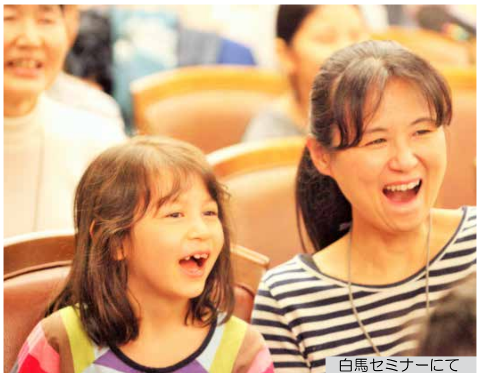
白馬セミナーにて

それにしても、相手からどう評価されるかに、相当影響されていたことをしみじみ感じました。職場の報告はネットを利用しているのですが、報告後に他のページに飛ぶ必要もなくなり、快適さが数段増