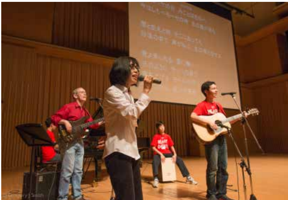
チア・コンベンションにて