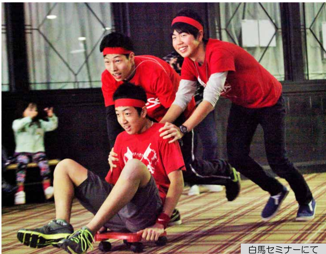
白馬セミナーにて

2月11日に行われたCSS保護者会にて、ソーシャルメディア断食へのチャレンジを自由参加で呼びかけました。応答したチャレンジャーたちの感想・第一弾をお届けします！