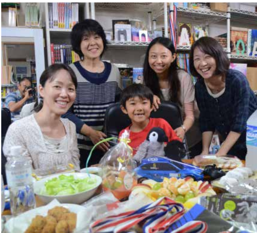
チア・オフィスにて

LA 空港に着いた時は自分で歩けず、車椅子で助けてもらう状況でした。1 ヶ月後、こうして走れる神さまの「恵みの力」。「人生のマラソン」においても、困難、失敗があっても、神さまからの深い恵みの力が降り注がれ続けていることを思いました。ゴールインは、天国の前味を味わっているような気持ちがしました。神さまの恵みを讃えます。