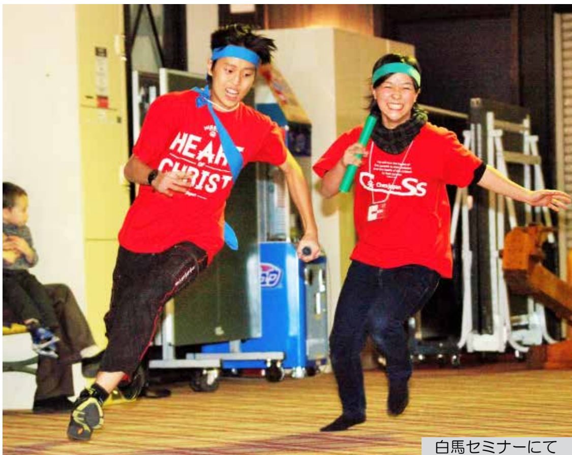
白馬セミナーにて

★今日も頑張ることができました!今日で始めてから5日経ちましたが、5日もパソコンを使わないことができたのは家にいる日では初めてのことです!最初はネット断食をやっている最中の一日一日が苦痛でたまらないのかなーと思っていました。でも、い