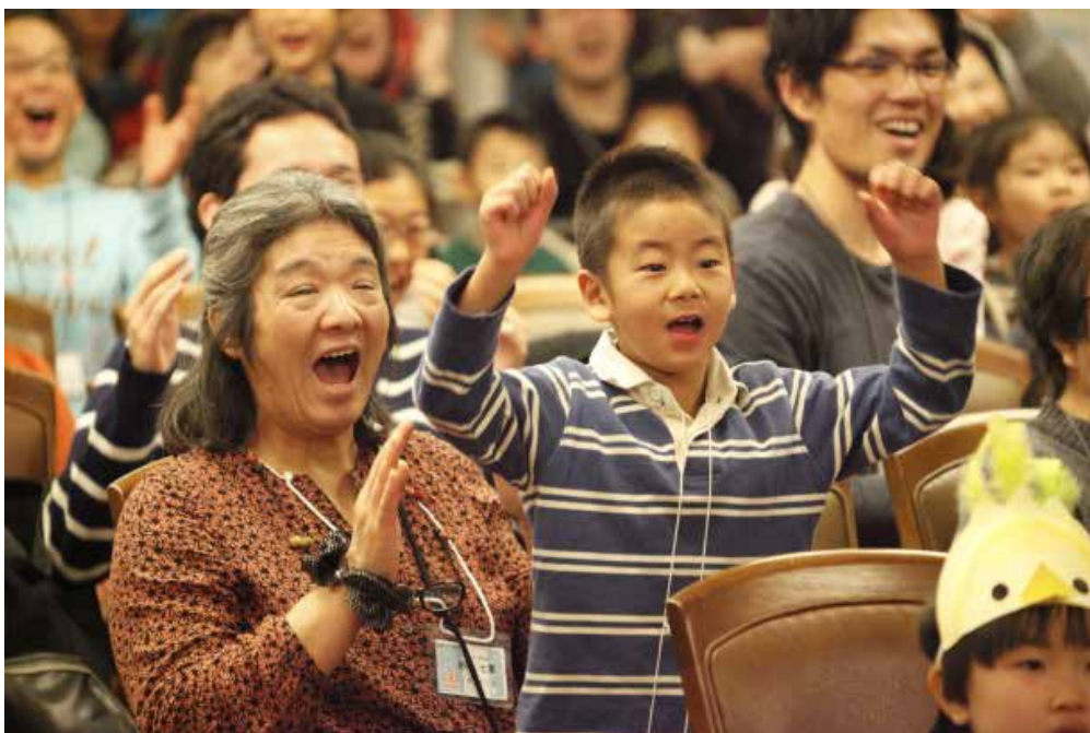
白馬セミナーにて

「偶像を拝んではならない」と聞いて、クリスチャンの多くは、自分は拝んでないから大丈夫と思いがちです。しかし、偶像礼拝は仏像、神棚ではありません。クリスチャンにとっては、何か疲れた時に依存するもの、困った時に頼る