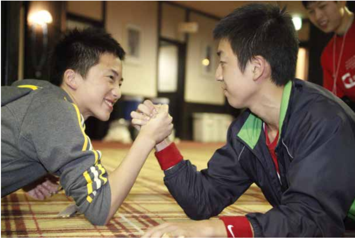
白馬セミナーにて

アダルトサイトを見てしまう自分が嫌で、パソコンをバットで破壊します。僕も、そのようにすべきだと思い、自分のアイポッド (ipod touch) を壊しました。その直後に与えられた特別なイエスさまとの関係や時間は形容しがたい深いものでした。それから2年、アイポッド等への回帰はありません。