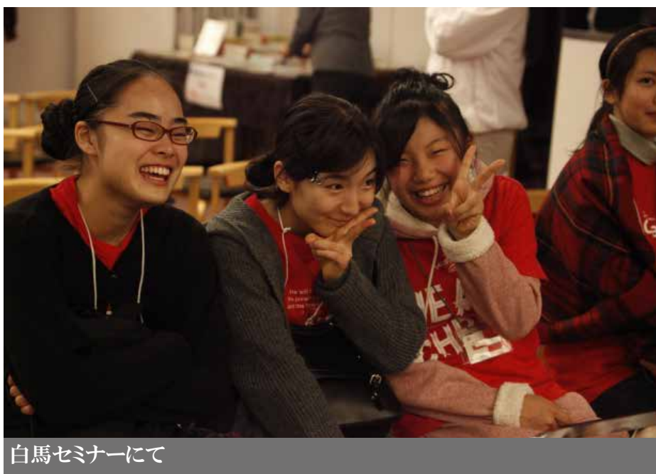
白馬セミナーにて

中間地点まで滑り降り、僕とジョセフのペアは、スキー学校の先生たち10人ぐらいが撮影している、その真ん中に入ってしまった。先生たちは、僕らの滑降を待っていました。それで、僕は滑り出しました。ちょっと先生たちの視線を意識して、『子どもを抱っこで滑って、いい感じで滑れているかなー？ 学生時代、1級取れず、2級どまりだった……。今の滑りなら、1級、取れるかなー？』と、フォーカスが「人にどう見ら