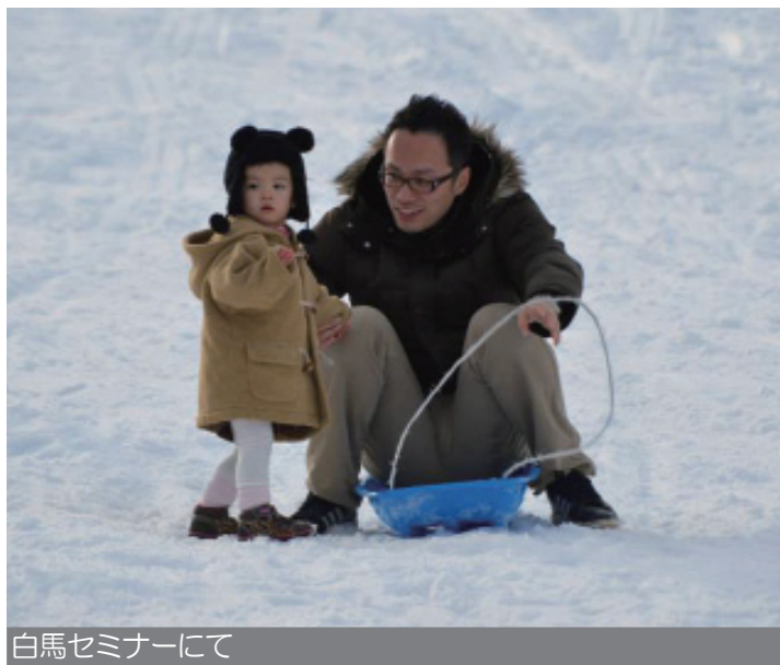
白馬セミナーにて

上記の文章にも書かせてもらいましたが、ホームスクーリングは、学校側に認めてもらうものではありません(^_^;)。もちろん、敵対関係になる必要はないし、礼節を尽くし、謙遜に、これまでの感謝と今後の展開の報告のご挨拶は、するべきだと思います。また、聖書が教える教育の本質を考えてもらうことをきっかけに、貴重な伝道の機会にもなりますので、求められたミーティングへの出席や、積極的な情報開示はとてもいいと思います。