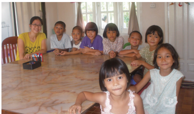
羊子さん、2年めも契約更新！