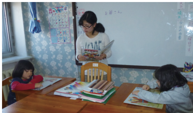
白板には、『お爺さん』という漢字が！