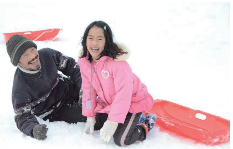
白馬セミナーにて