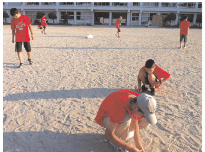
LITは朝5時から、朝日を浴びて、打ち上げ花火のゴミ拾い！