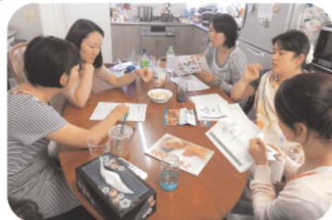
コンベンション翌日の分かち合いの時

代々木でのコンベンション、ご苦労様でした。参加した教会の方々から、「とても良かった」と聞きました。翌日曜日の礼拝後に、祝福の分かち合いをしていました。また次回、東京でコンベンション等が行われる時には、人を誘いたいし、私も続けてブースを出させていたただきたいと願っております。（SYME 加藤義人）