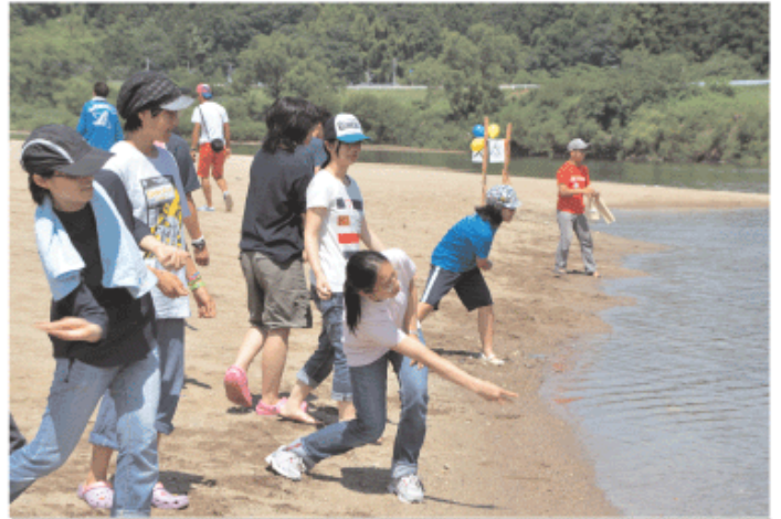
水切りに挑戦！（全国大会会場にて）

・キャンプに来ると、いつも靈的にリフレッシュされる感じです。このような安心する場所に、家族と一緒に来られることは祝福です。このキャンプでは、クリスチャンとしてポジティブになれ、また来るのが楽しみになります。