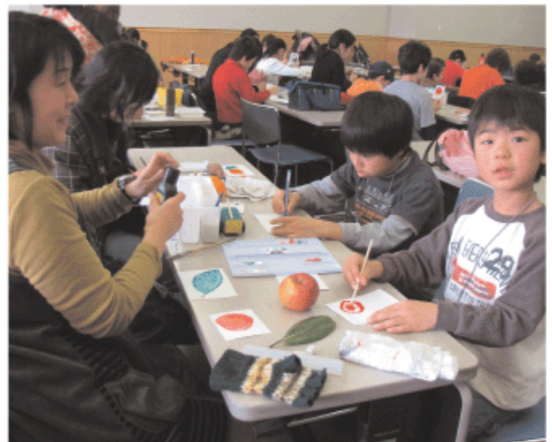
絵手紙もOK！(第8回関東ミニ学習会より)

■ 送り先 ：〒338-0013 さいたま市中央区鈴谷8-7-13- 207 チア・にっぽん事務局 「絵画コンクール」係