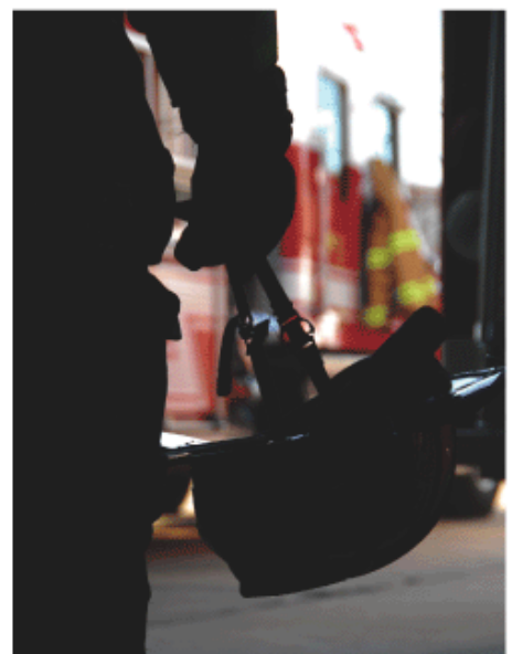
「ファイアー・ストーム」より