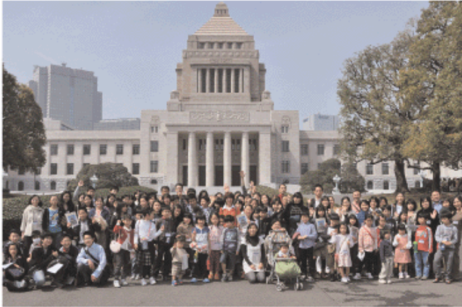
国会議事堂前で記念撮影