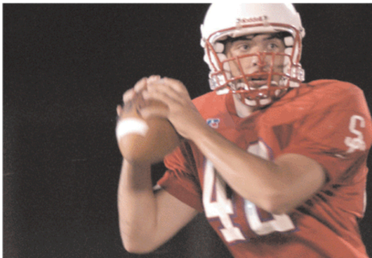
「フェイスング・ザ・ジャイアント」より