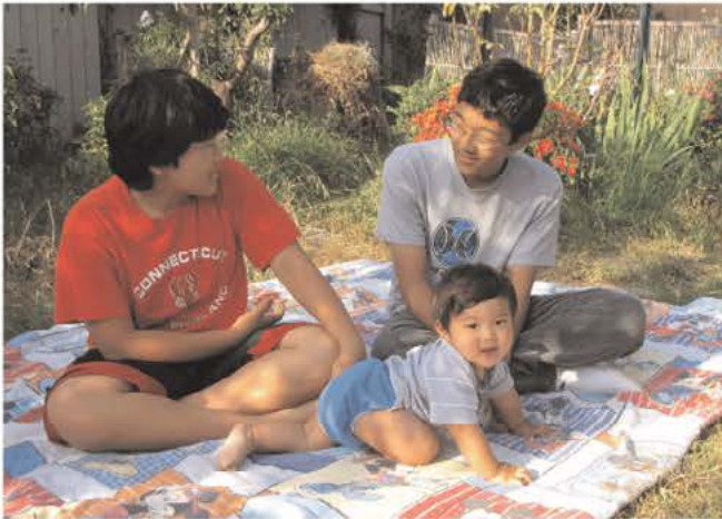
ピクニックも日課になりました

する未来完了の信仰を持っていくことも示されます。そして、主が開いてくださる限り、今できる最大限のことをしておこうと思っています。足踏みしていなければ、こんなリサーチも十分できずに、あわてて進まざるを得なかったかもしれないので、良かったナーと主に感謝もしています。ここでも、捨てられた「礎の石」として、歩いていければと思って進んでいます。